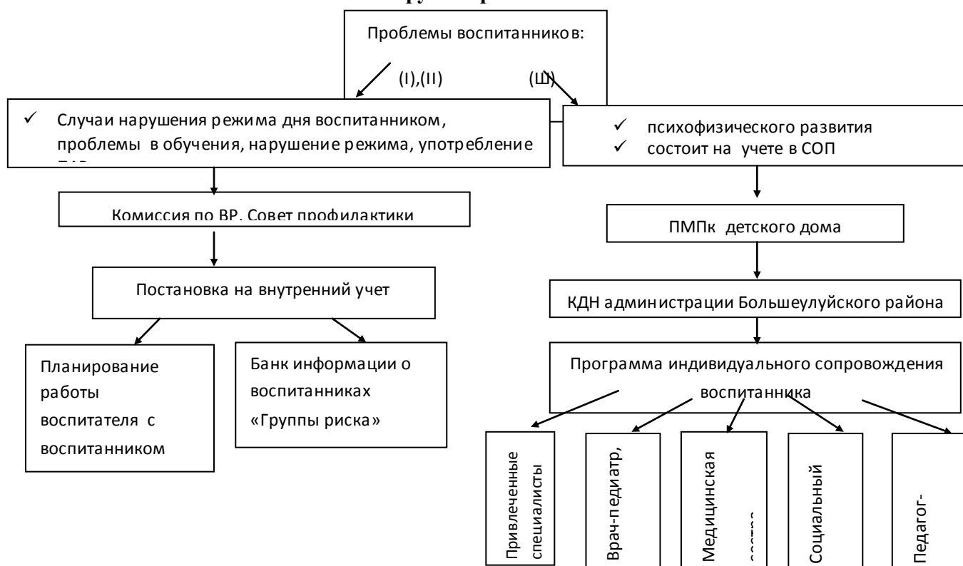
Схема реализации образовательно-воспитательной работы с воспитанниками «Группы риска».